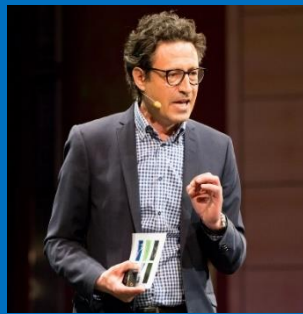
Georges T. Roos University Office for Cultural Innovation